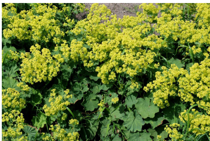
A, Alchemilla mollis, Løvefod