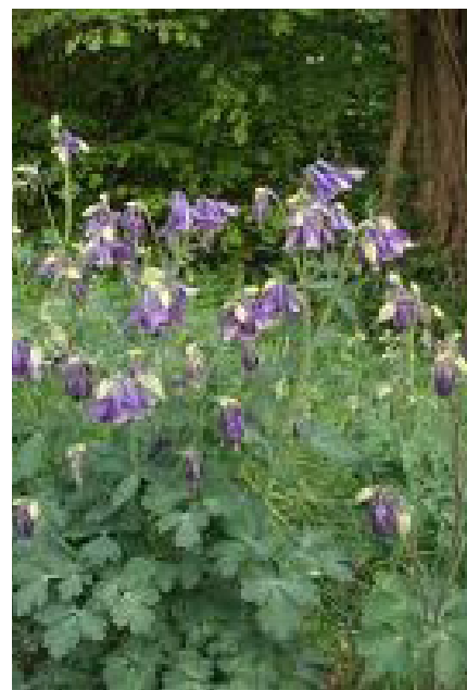
Aq, Aquilegia vulgaris, Akeleje