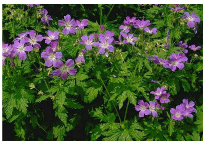
G, Geranium Sylvaticum, Skov-Storkenæb