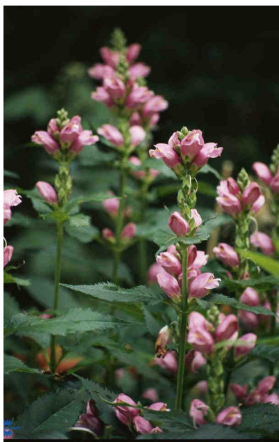
Co, Chelone obliqua, Duehoved