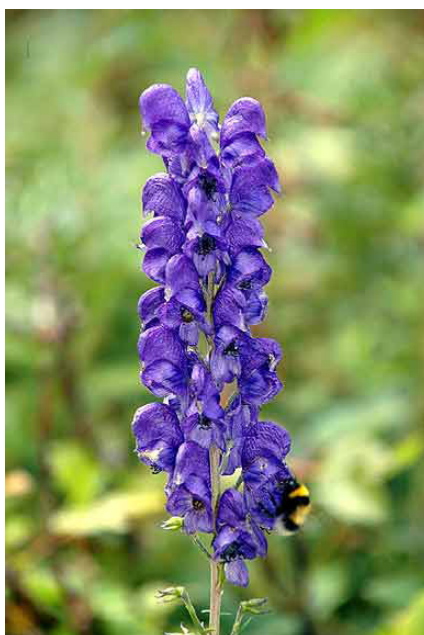
Ac, Aconitum napellus, Ægte stormhat